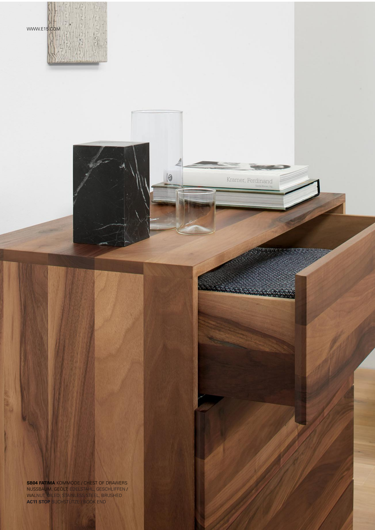
SB04 FATIMA KOMMODE / CHEST OF DRAWERS NUSSBAUM, GEÖLT, EDELSTAHL, GESCHLIFFEN / WALNUT, OILED; STAINLESS STEEL, BRUSHED AC11 STOP BUCHSTÜTZE / BOOK END