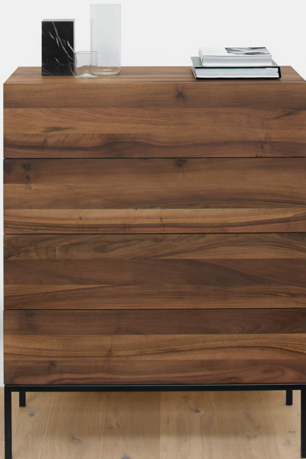
SB04 FATIMA KOMMODE / CHEST OF DRAWERS NUSSBAUM, GEÖLT; STAHL, PULVERBESCHICHTET, TIEFSCHWARZ / WALNUT, OILED; STEEL, POWDER-COATED, JET BLACK AC11 STOP BUCHSTÜTZE / BOOK END FK03 ASWAN HOCKER / STOOL CP02 NEYRIZ KELIM / KILIM